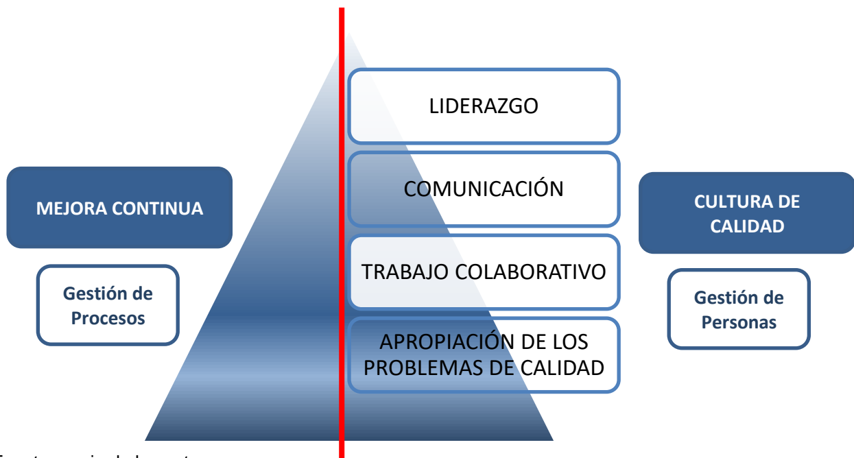
Diagrama 2. Mejora continua – Cultura de calidad educativa

El creciente interés por la evaluación en la educación superior ha llevado a la proliferación de modelos destinados a mejorar la enseñanza y el aprendizaje. Los modelos y marcos conceptuales más eficaces dependen de las interrelaciones, centrándose en las asociaciones entre profesores y administradores; Estas colaboraciones se basan en objetivos y prioridades compartidos y proporcionan mecanismos para diseñar e implementar prácticas de evaluación coherentes en toda la institución.